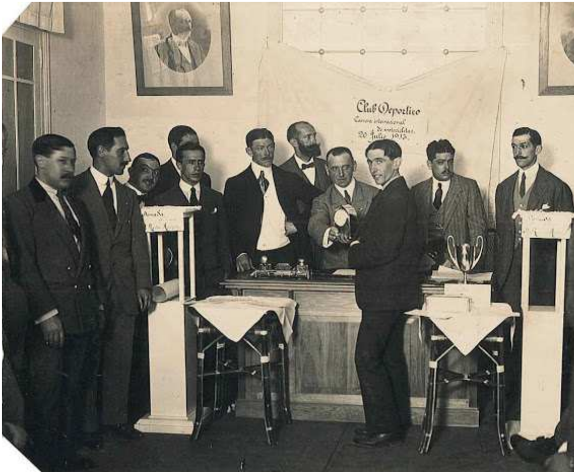
Trofeo a Sorriguieta

El recorrido oficial de la carrera es este: